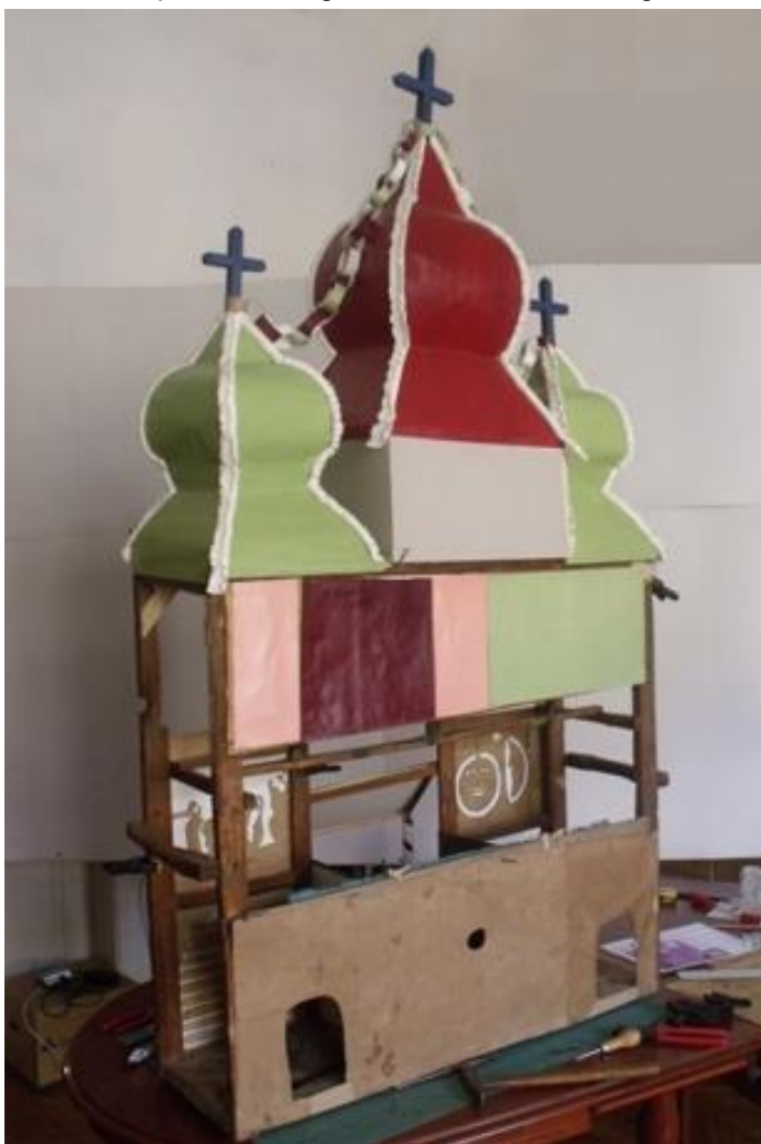
A betlehem hátoldala munka közben.