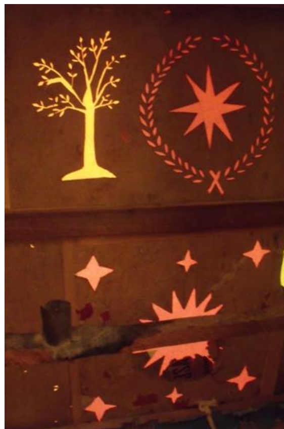
A restaurált betlehem néhány motívuma átvilágítva.