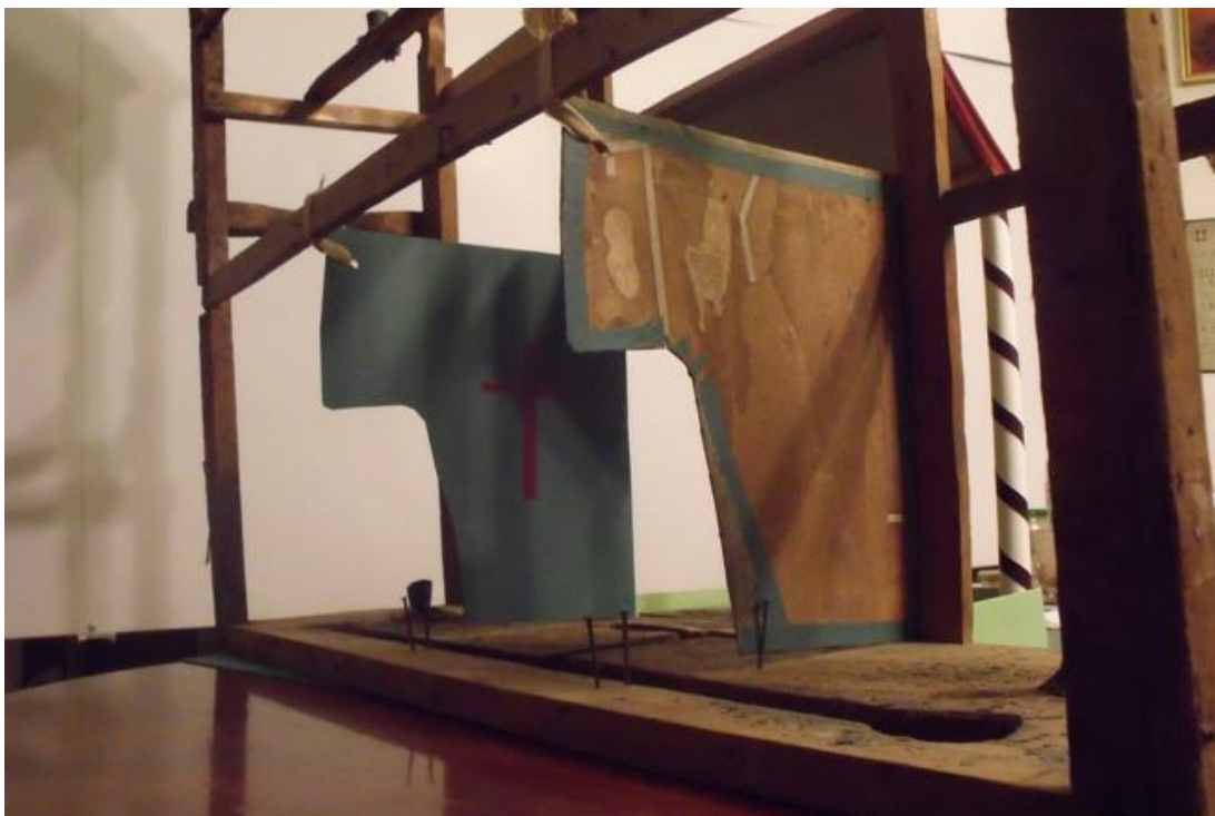
Az oldalkulisszák beépítése. A pótlás borítópapírokkal ellátott eredeti, savtalanított, kalcium-hidroxiddal pufferolt, kiegészített kartonok felszegelése az eredeti helyükre.