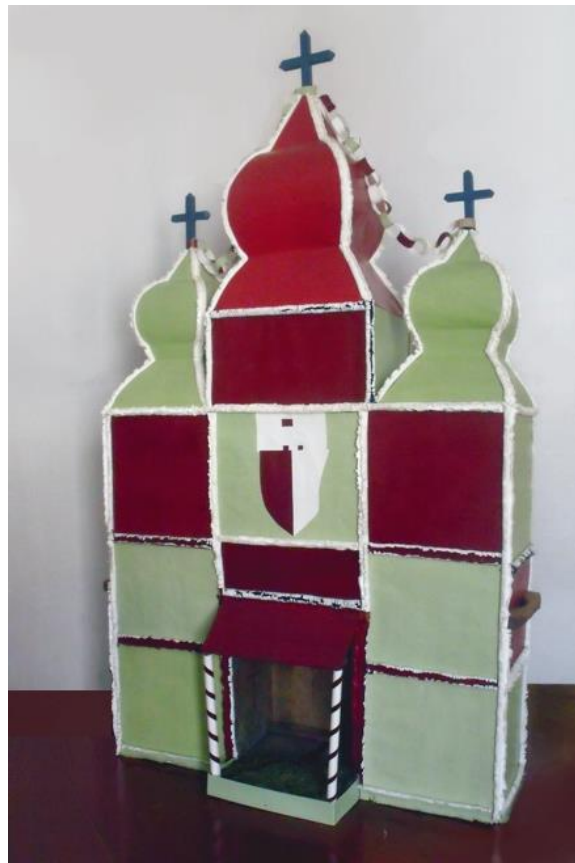
A szatmárcseki betlehem restaurált állapotában hátul-nézetben és elől-nézetben.