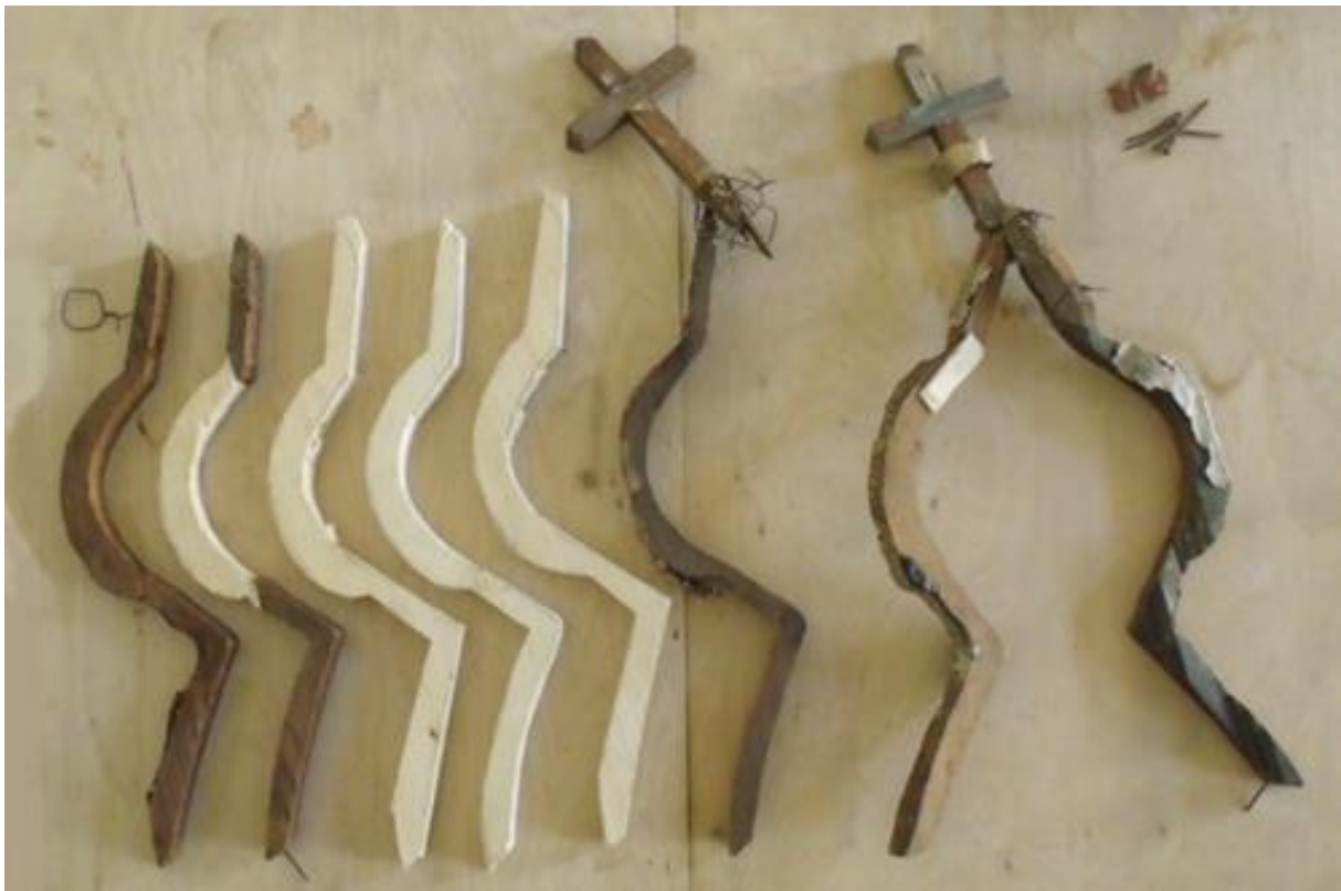
A két szélső toronysisak kiegészített fa szerkezete, összeállítás előtt.