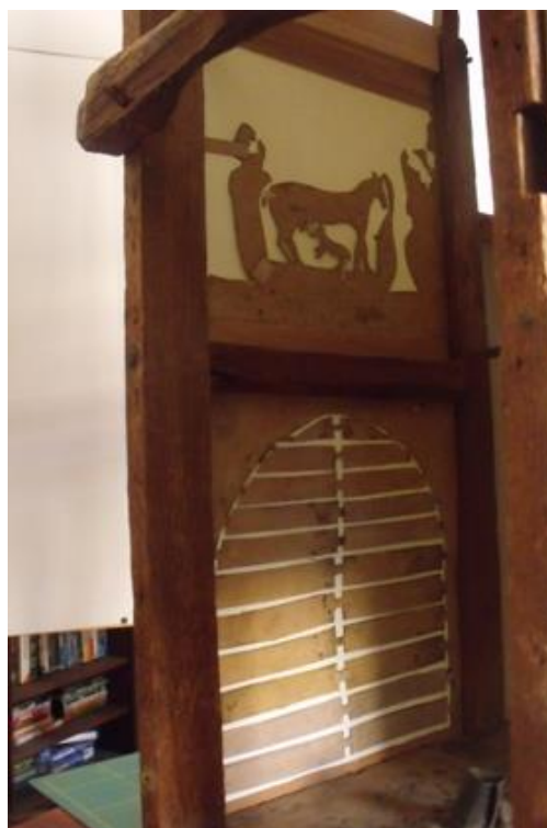
A betlehem elejének két mezője, felszegelve, hátoldal felől.