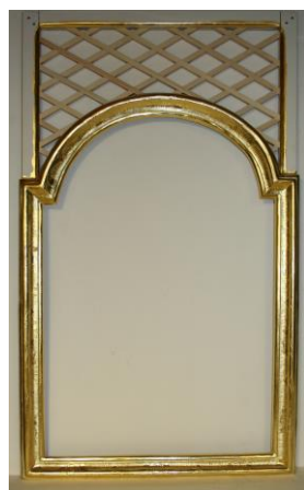
Az ikonkeret összeállításának, restaurálásának különböző fázisai