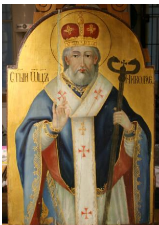
Szent Miklós ikonja munka közben