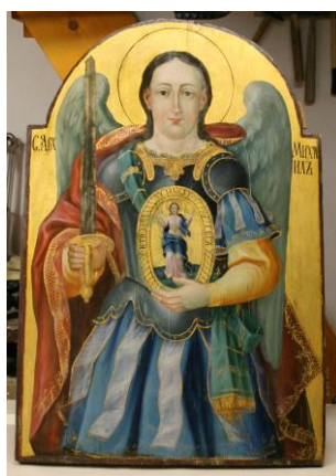
Szent Mihály ikonja restaurálás után