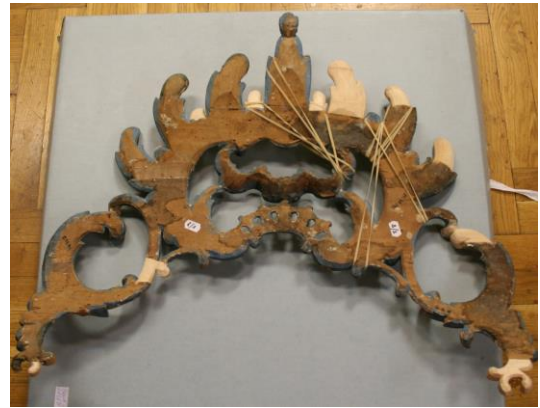
A Szent Miklós feletti rokály kipótolt, ragasztás közbeni állapotban – előlről és hátulról