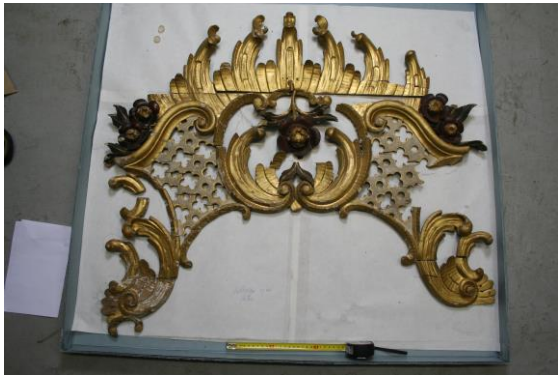
A királykapu feletti faragás- töredékes állapotban