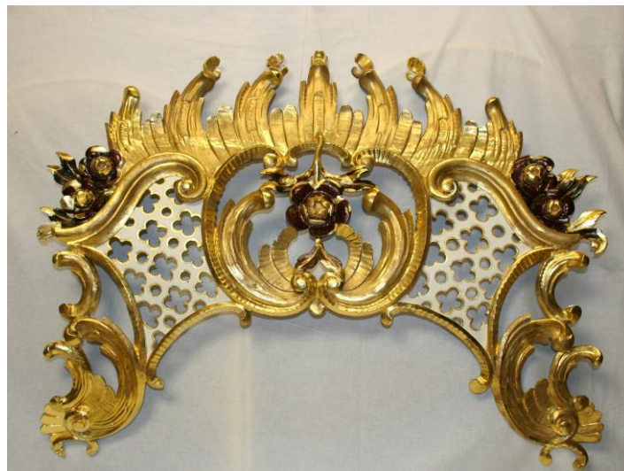
A restaurált dísz