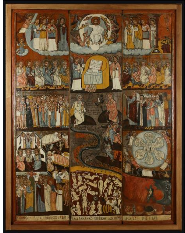
Restaurálás utáni állapot