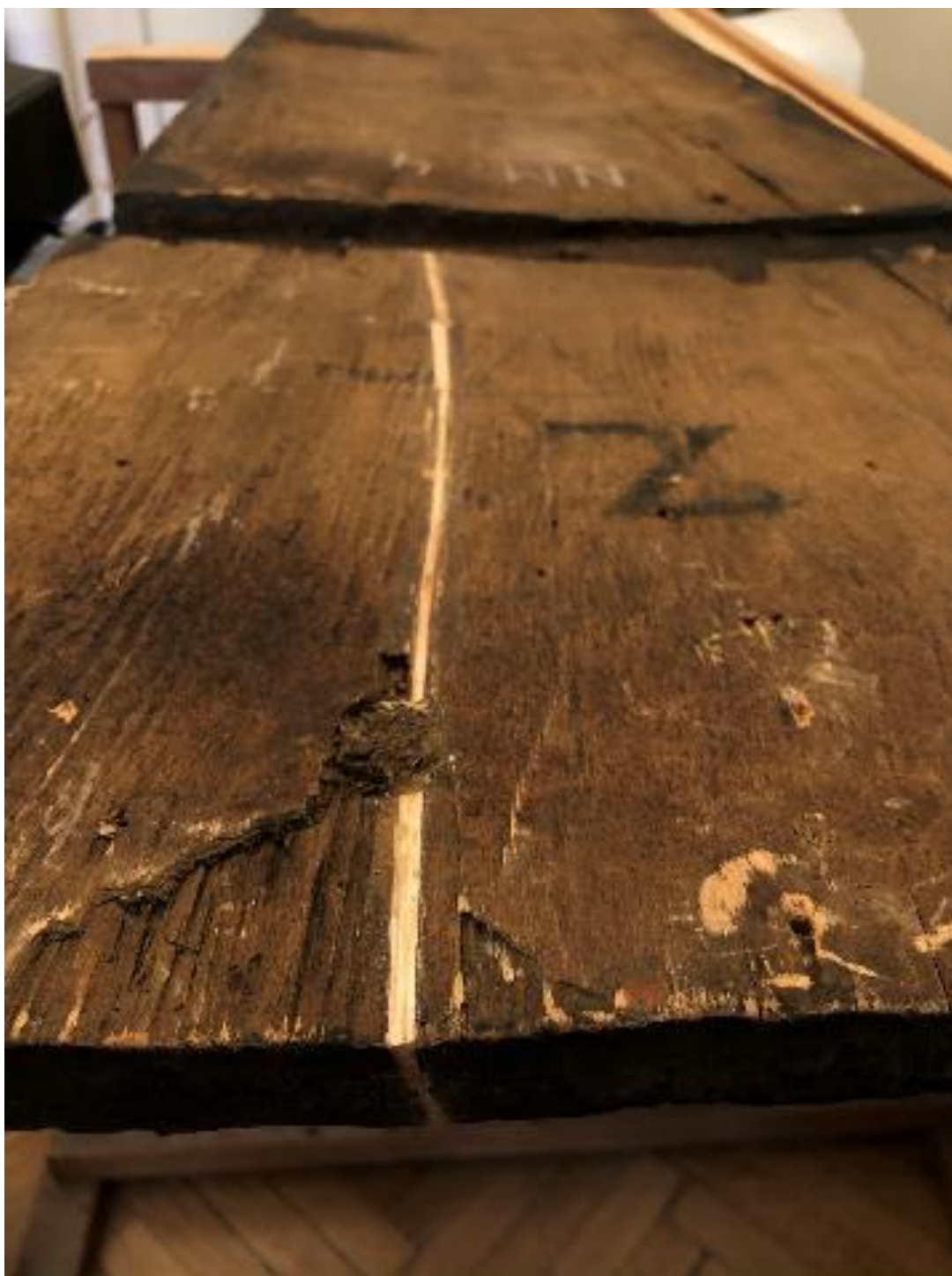
Famunka elvégzése (részlet)