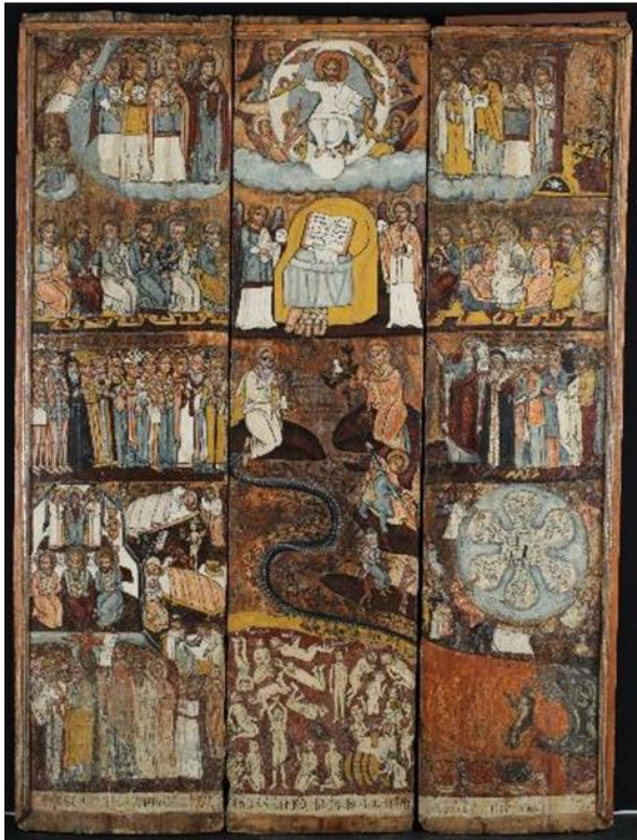
Restaurálás előtti állapot