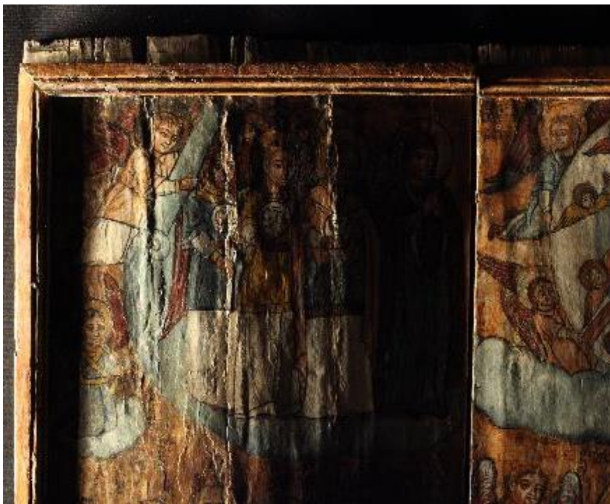
Átvételi állapot, sűrűfényes felvétel

Az elkészült műtárgy a kiállítás megkezdéséig a Néprajzi Múzeum gyűjteményi terében lesz elhelyezve, ahol folyamatos a klimatikus viszonyok ellenőrzése.